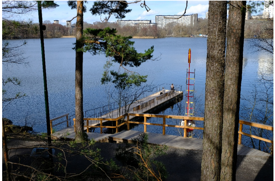
Bild 2. En av stadsdelsförvaltningens solbryggor utmed Årstaviken (Stockholms stad 2026).

Det är relativt kort från strandkant till gränsen för badområdet på Årstavikens södra strand och stadsdelsförvaltningen bedömer därför att det är svårt att anlägga en brygga för bad på tillräckligt djupt vatten. På andra sidan Årstaviken, där Södermalms stadsdelsförvaltnings badbrygga ligger, är det längre mellan strandkant och gränsen för badområdet och därför bättre förutsättningar för en badbrygga.